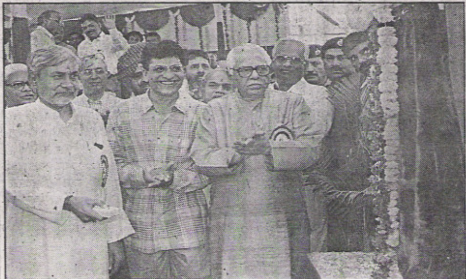
मध्य रेल्वे मार्गावरील भांडूप आणि मुलुंड या स्थानकांदरम्यान बांधण्यात येणार असलेल्या नाहूर स्थानकाच्या पायाभरणी समारंभाच्या वेळी रेल्वेमंत्री नितीशकुमार, पेट्रोलियम मंत्री राम नाईक व भाजपा खासदार किरीट सोमय्या हे दिसत आहेत.