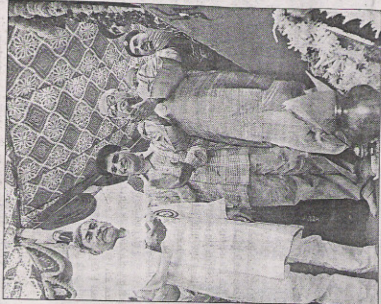
नाहूर में रेलवे स्टेशन का शिलान्यास करते हुए रेलमंत्री नीतीश कुमार, साथ में कीरीट सोमैया और केंद्रीय पेट्रोलियम मंत्री राम नाईक

इस मांग को पूर्ण कराने में महत्वपूर्ण भूमिका ले निभाने वाले स्थानीय सांसद किरीट सोमैया ने बताया कि पिछले साल चालीस वर्षों